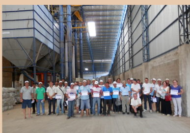
Cafeicultores reunidos no armazém da Coaabriel

Nos meses de março e abril, o Cetcaf está com a agenda completa para os treinamentos "Café com Sustentabilidade" – Colheita e pós-colheita, divulgando e incentivando os cafeicultores do Espírito Santo a participarem e ficarem por dentro de ações que ajudem a alavancar a produção capixaba.